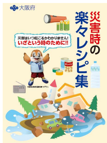
【 レシピ集・表紙 】