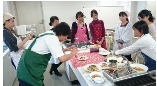
【 写真撮影 】