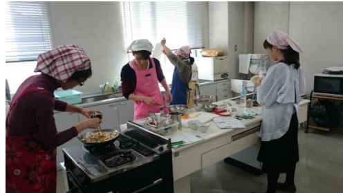
【 調理実習・試作 】