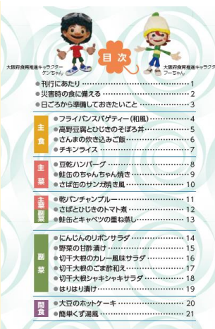
【 目次 】