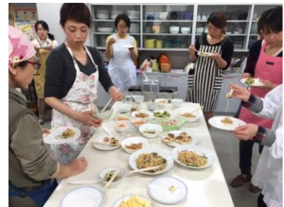
【 試作品試食 】